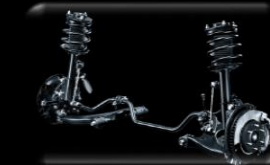
Suspensión Delantera McPherson + Barra estabilizadora