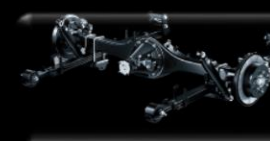
Suspensión trasera con ballestas