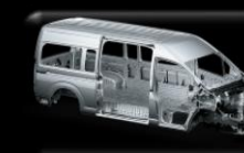
Carrocería tipo GOA