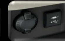
Conector de 110V