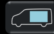
Panel de techo bajo carga hasta 6.2 M2